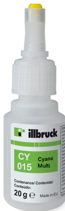
illbruck CY015 Sekundové lepidlo - Multi